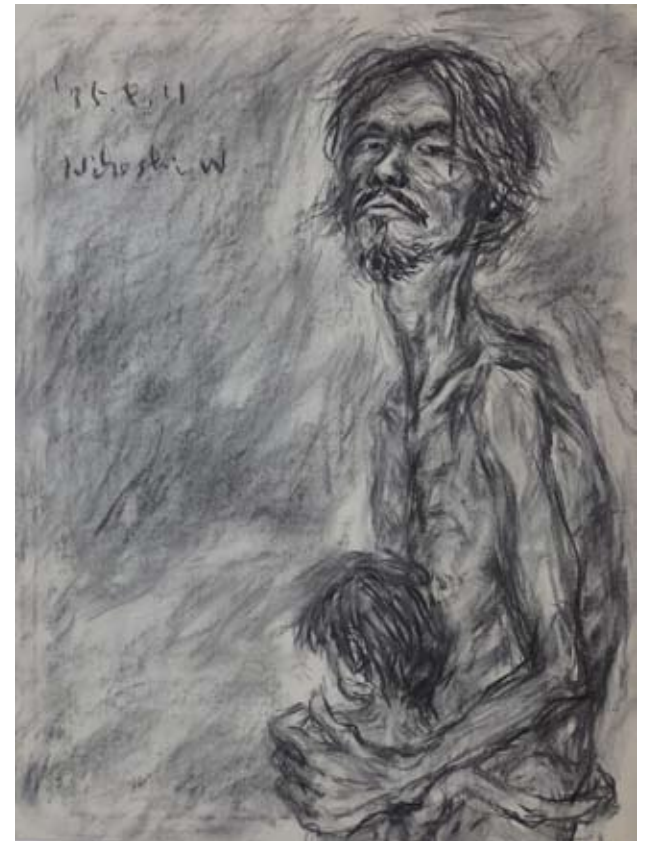
「息子を抱く自画像」1975年 木炭、紙 64.0×49.0cm