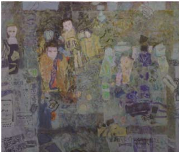
「人形たち」1991年 油彩、キャンパス 60.6×72.7cm

1938年新潟市生まれ。熊谷喜代治にデッサンを学び、後笹岡一に師事。日展、光風会に出品し、66年光風会会員となるが、68年退会。以後は紀伊国屋画廊、美術ジャーナル画廊、現代画廊、ギャラリーXepia、ギャラリー汲美、(株)東京現像所、K'sギャラリー、セッションハウス(いずれも東京)、ギャラリー-DEN(ドイツ・ベルリン)などで個展により発表。新潟での個展は91年新潟伊勢丹、2002・05・08・12・16年新潟絵屋。千葉県南房総市在住。