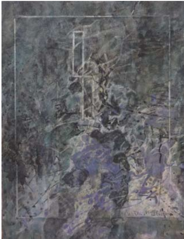
「無量光」2013年 水彩、紙 53.0×41.0cm