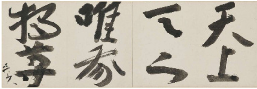
《天上天下唯我独尊》1940年