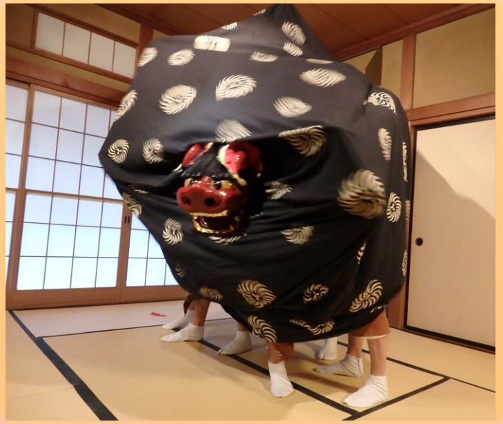
中央区西大畑のお屋敷で