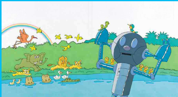
ロボくんとことり(フリーベル館刊1999年)