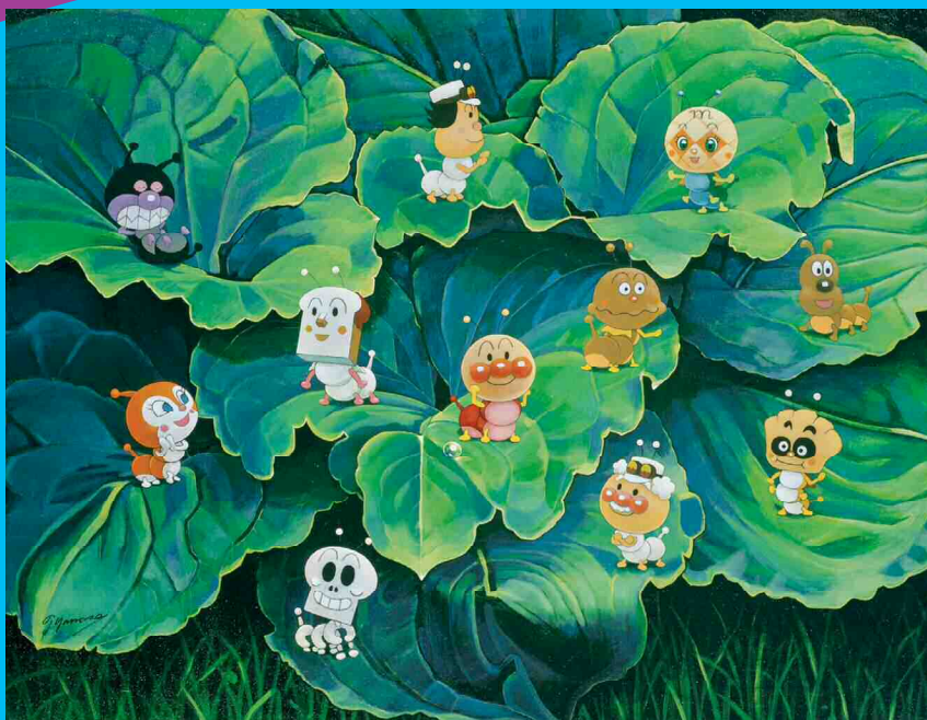
虫になったアンパンマンたち

やなせたかし(1919-2013)は、アンパンマンの生みの親であり、童謡「手のひらを太陽に」などの作詞も手掛け、漫画家・詩人・イラストレーターとして幅広く活躍しました。その温かくユーモラスで、ときに哲学的な作品は、まだ言葉を持たない幼児をも魅了し、大人には大切なものを思い出させてくれる強い力を持っています。本展は、アンパンマンを描いたキャンパス画のほか、「やさしいライオン」などの絵本原画、直筆の漫画や詩の原稿を中心とした約350点で、やなせの多彩な軌跡をたどります。