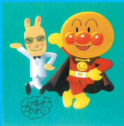
アンパンマンとやなせうさぎ