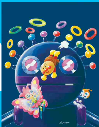
ようせいリンリンのひみつ

やなせたかし(1919-2013)は、アンパンマンの生みの親であり、童謡「手のひらを太陽に」などの作詞も手掛け、漫画家・詩人・イラストレーターとして幅広く活躍しました。その温かくユーモラスで、ときに哲学的な作品は、まだ言葉を持たない幼児をも魅了し、大人には大切なものを思い出させてくれる強い力を持っています。本展は、アンパンマンを描いたキャンパス画のほか、「やさしいライオン」などの絵本原画、直筆の漫画や詩の原稿を中心とした約350点で、やなせの多彩な軌跡をたどります。