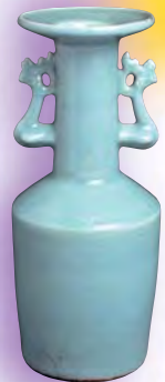
重要文化財 碓氷磁風耳花生 銘 千聲 京都・四朗文庫（8/30〜9/25展示）