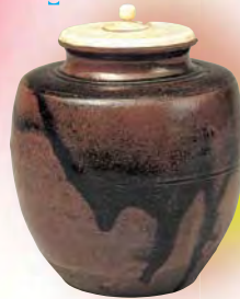
重要文化財 大名物 唐物肩衝茶入 銘 初花 東京・徳川記念財団（7/14〜9/25展示）