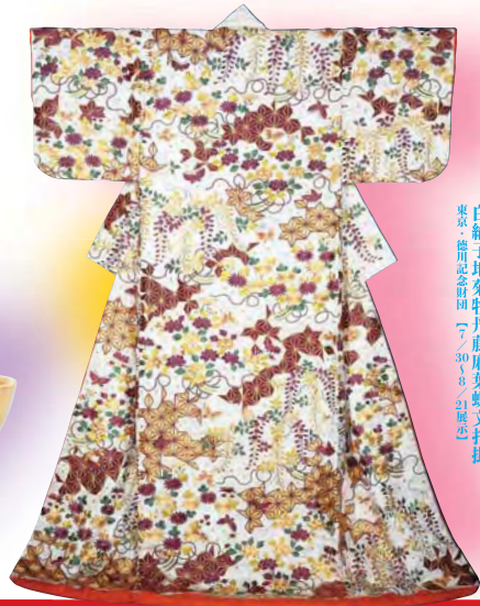
白織子地菊牡丹藤麻葉蝶文打掛 東京・徳川記念財団（7/30〜8/21展示）