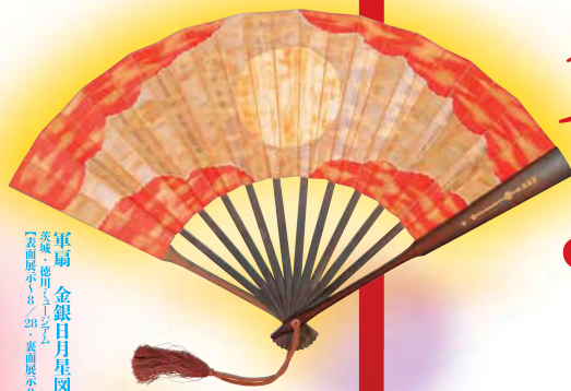
軍扇 金銀日月星図 表裏展示 8/28 裏面展示 8/30