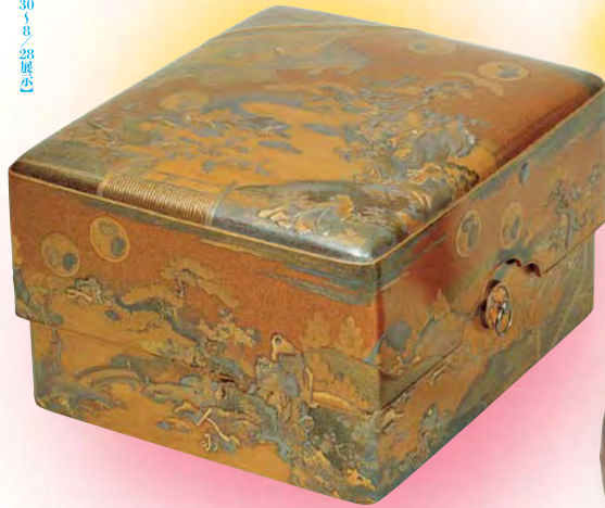
国宝 初音時絵御箱 愛知・徳川美術館（7/30〜8/28展示）