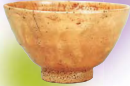
大名物 井戸茶碗 銘 大高麗 愛知・徳川美術館（全期間展示）