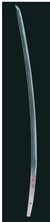
重要美術品 太刀 銘 国綱 東京・徳川記念財団(東京国立博物館寄託) (全期間展示) 全国初公開