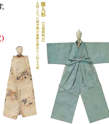
雛人形 (全面黒染) 人形とご着物少間の家康を祀るため伝える品