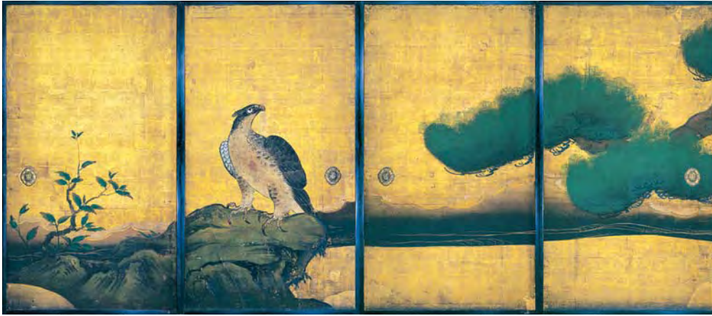
重要文化財 二条城の丸御殿 大広間四の間 西側 「松鷹図」 京都・元徳宮 茶城事務所 (7/30/8/20展示)

徳川家康(1542~1616)は、およそ250年にもわたる太平の世の礎を築きました。家康没後400年を記念する本展では、その生涯や人となりをしるす遺品、将軍家・御三家・ゆかりの寺社などに受け継がれた名宝や、太平の世のもとで豊かな成熟をみた武家・公家・町人らの文化を伝える作品などを通じ、江戸の歴史と文化を多面的に紹介します。信長・秀吉から家康へとわたった「大名物」の茶道具、蒔絵の至宝である「初音の調度」(国宝)、将軍家の威光をあらわす京都・二条城の障壁画(重要文化財)など、新潟では初公開となる名宝約100点が、全国各地から一堂に会します。